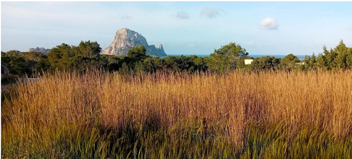
Hyparrhenia hirta en Ibiza, al fondo el mar y el islote de Es Vedrá en abril, 2025

Creo que es muy poco frecuente que una vulgar gramínea llame la atención de un pintor y sea objeto de una obra artística, por eso me ha parecido interesante traerla a este Boletín.