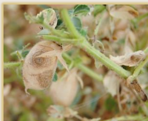
En vainas de lenteja