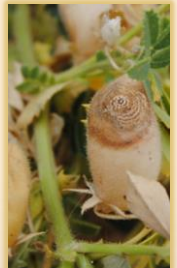
Sintomatología en guisante