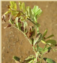
Síntomatología en veza