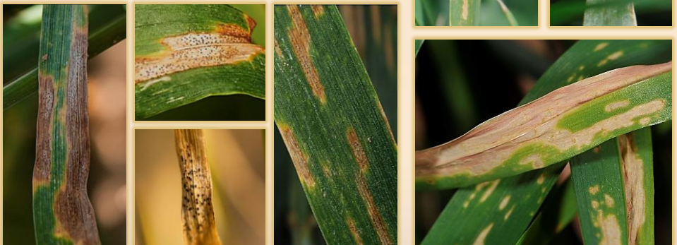
Manchas con picnicios visibles