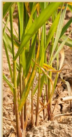
Sintomatología en parcela y plantas