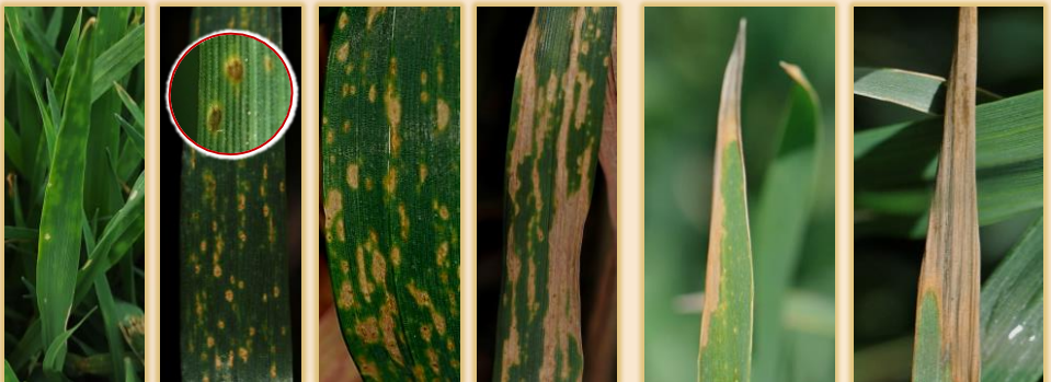
Evolución de las manchas